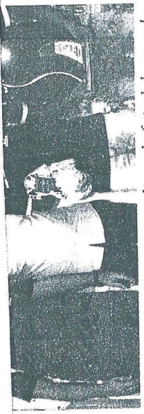
Ele é um dos maiores jogadores de futsal do mundo. Escolheu Fortaleza para viver e, aqui, cuida de vários projetos interessantes, envolvendo a garotada. Manoel Tobias é um craque e um cidadão.