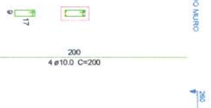
04 PLANTA DE PILARES ESCALA SEM ESCALA